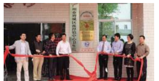
医联体揭牌仪式现场

医联体后,双方将在人才培养、技术支持、双向转诊等方面开展合作。广医五院将定期派出专家到派潭镇中心卫生院坐诊,为卫生院医护人员开展培训,将该院在康复医疗、微创外科方面医疗服务和技术知识引入至当地,让当地群众在家门口享受优质服务。同时,广医五院将开通人才培养通道,派潭镇中心卫生院将定期派出医护人员到广医五院学习,促进基层医院医疗服务队伍综合素质和能力提升。