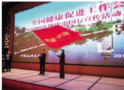
王贺胜向“2017年健康中国行”活动首站山东省授旗,正式启动今年健康中国行宣传活动。

《广州卫生计生》综合报道 为了贯彻落实全国卫生与健康大会和第九届全球健康促进大会精神,推进实施《关于加强健康促进与教育的指导意见》和“十三五”全国健康促进与教育规划,继续加强健康促进工作,4月13-14日,国家卫生计生委在山东济宁任城区召开全国健康促进工作会议,并同步启动2017年健康中国行宣传活动。教育部、工商总局、体育总局、国家中医药局、中国科协等部门相关司局,各省、自治区、直辖市卫生计生委,新疆生产建设兵团卫生局,委机关各司局和相关直属联系单位,有关专家和媒体代表约500人参加了会议。国家卫生计生委副主任王贺胜出席会议并讲话。王贺胜充分肯定了健