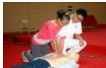
图2:胸外心脏按压操作