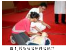
图1:判断颈动脉搏动操作