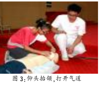
图3:仰头抬颌,打开气道