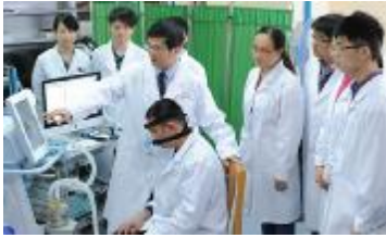
陈荣昌教授(左三)在进行带教指导

近日,国家卫生计生委在北京召开全国卫生计生系统表彰大会,表彰全国卫生计生系统先进集体、先进工作者和劳动模范及“白求恩奖章”获得者,广东省共有12个先进集体和51名先进工作者获得荣誉。广州医科大学附属第一医院、广州呼吸疾病研究所所长陈荣昌教授荣获全国先进工作者称号。广东省获此殊荣的只有3人,他就是其中之一。