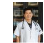
广州医科大学附属第一医院广州呼吸疾病研究所所长陈荣昌教授

陈荣昌作为教授、博士生导师长期从事临床教学工作,参与大学本科、研究生和进修医生的教学和临床实践带教工作,他具有一名优秀教师所具备的仁心仁术,他经常深情地教导学生:“学医的目的,是要解除病人的痛苦,把病人的痛苦当成是自己的痛苦,这样才会有紧迫感和责任感。”在教学工作质量评估中,他以优秀的成绩获得好评。在教学工作中,他善于结合日常工作开展科研,研制出纤维内镜电脑监护系统,提高了教学质量。他编写了《呼吸内科学》、《呼吸系统疾病诊疗常规》、《呼吸系统疾病诊断学》,无创人工气道临床应用等书籍,为提高教学质量、培训高素质人才提供了合适的教材。因为在教学工作上的突出表现,陈荣昌获得了全国师德先进个人荣誉称号。