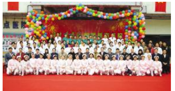
广东药学院附属新市医院挂牌大合影