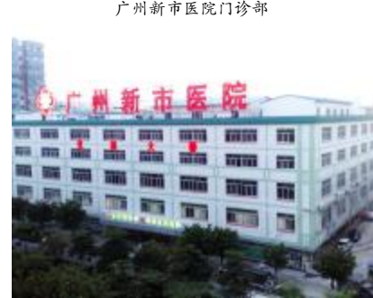
广州新市医院门诊部

规模跨越发展: 广东药学院附属第三医院(又称广州新市医院),创建于2003年10月,当时医院设置床位20张,员工32人。2007年,住院楼开始启用,通过广东省卫生厅专家组验收,正式批复通过二级综合医院验收,由广东省卫生厅直接管辖(后转为广州市卫生局管辖),医院床位逐步增加至400张,人员增加到500余人。随着2013年新院区分批建设装修,至今已经开设床位1200张,完成后将达到1600张床位规模。