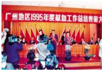
广州地区1995年度献血工作总结表彰大会。