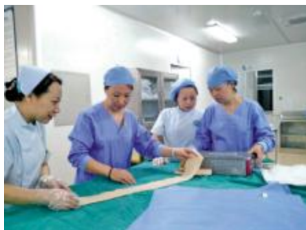
护士长和同事共同商讨工作流程

跟着紧张的节奏一直忙碌的科室还有很多,比如完成手术任务的麻醉科和手术室,遵循医学的誓言,面对患者生命健康的需要,他们毫无怨言。