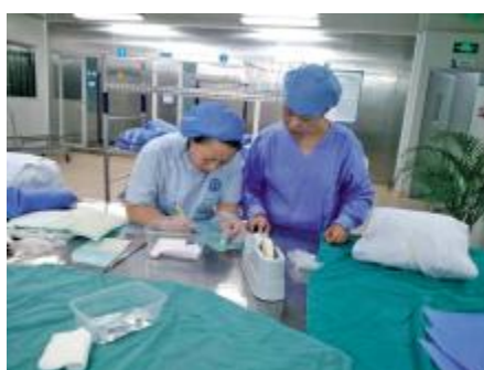
供应室工作人员正在加班