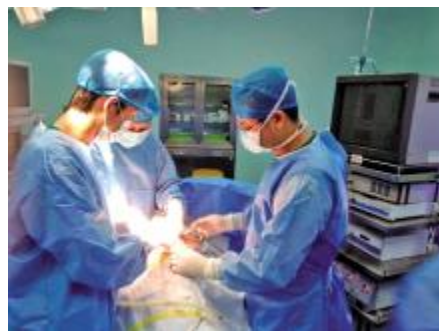
医生们在忙碌地手术中