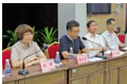
符华胜同志、唐小平同志、何希同志出席会议

穗计卫讯 根据市委“两学一做”学习教育工作推进会精神,为进一步加大“两学一做”学习教育推进力度,7 月 8 日,市卫生计生委召开“两学一做”学习教育推进会,对“两学一做”学习教育进行再动员、再部署、再推动。市委组织部分巡视员符华胜同志出席会议并讲话。市卫生计生委党组书记唐小平同志,市卫生计生委党组成员、副主任何希同志出席会议。