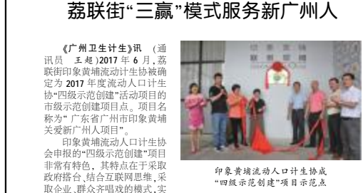
印象黄埔流动人口计生协会“四级流动人口”项目示范点

【广州卫生计生】讯 (通讯员 王超)2017年6月，荔联街印象黄埔流动计生协被确定为2017年度流动人口计生项目市级示范创建项目。项目命名为“广东省广州市印象黄埔关爱新广州人项目”。