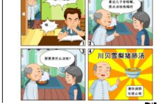
漫画内容围绕一家五口温馨之家的日常展开，以家庭生活为背景，描绘7岁烟嫂的“钟无艳”与老烟枪爸爸的各种斗智斗勇场景。(广州卫生计生)从今年第10期起，连载，以连载。

由广州市卫生计生委、共青团广州市委员会指导，公益画师张颖波绘制的《广州烟嫂365》是广东省内第一本以烟嫂知识为主题的漫画。