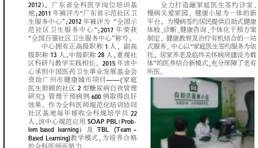
海珠区龙凤街社区卫生服务中心自助健康小屋

海珠区龙凤街社区卫生服务中心业务用房5100平方米，定编康复床位85张，是集基本医疗、基本公共卫生、社区教学、社区科研于一体的社区卫生服务中心。2009年该中心成为中国社区卫生协会第一批实践基地(2009-2012)、广东省全科医学岗位培训基地；2011年被评定为“广东省示范社区卫生服务中心”；2012年被评为“全国示范社区卫生服务中心”；2017年荣获“全国百强社区卫生服务中心”称号。