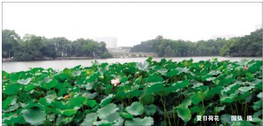
夏日荷花

乾隆时期,京城的达官贵族都热衷吸烟,在当时成为一项时尚雅致的上层娱乐活动。乾隆烟瘾也不小,后来突然有一次他无故咳嗽不止,太医诊治后说:“病源在肺,恐怕是吸食烟草导致的。”