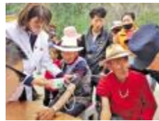
中山一院东院专家为藏民进行义诊。

此次,东院把党和国家关怀送至边远地区的人民群众,充分展现了东院人风貌和黄埔精神,发挥黄埔优质医疗资源辐射和带动基层医疗工作巨大作用,并进一步扩大东院辐射能力。此外,东院领导还要求全体队员要认识到肩负的使命,充分发挥业务特长,服务好当地百姓,为民族团结和群众健康做出自己的贡献,并为东院履行更好社会责任开好个头!