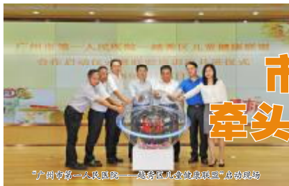
“广州市第一人民医院—越秀区儿童健康联盟”启动仪式