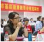
培训现场,学员们进行理论和实践学习。