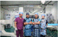
小时内完美完成了急诊PCI手术,顺利完成血管重建,植入3枚支架,患者瞬间转危为安。

心脏介入手术的顺利开展,标志着广州开发区医院周围血管介入、神经介入介入治疗后,迎来了“三驾马车”并驾齐驱的新篇章,在医者们着力打造核心学科品牌建设的进程中具有里程碑的意义。