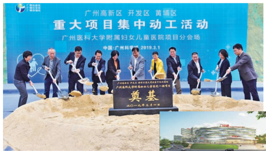
▲奠基仪式 一期工程门诊楼效果图

春风送暖,万象更新。2019年3月1日,由广州市与广州高新区、开发区、黄埔区共建的广州医科大学附属妇女儿童医院举行项目动工活动。动工活动的顺利举行标志着一期工程正式开建,预计将于2020年底完成工程建设,2021年门诊开业。根据市、区、校共建协议,医院建成后整体移交广州医科大学,委托具有妇产科学科优势的广州医科大学附属第三医院(以下简称:广医三院)运营。