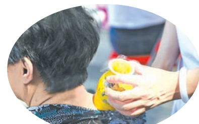
(市民现场体验中医疗法)

我市拥有广药集团、香雪制药等一批成熟发达的中医药企业,拥有8家老字号中药企业,陈李济获得“全球最长寿药厂”吉尼斯世界纪录;拥有广药集团、白云山、陈李济、王老吉、中一、抗之