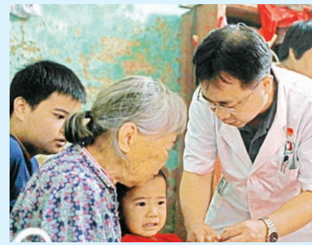
▲儿科党员医生为早产儿做检查

2019年1月,在该院新生儿科出生的600克宝宝“小可乐”救治故事引发媒体多方关注,这是广医三院目前救治存活胎龄最小的超低体重儿,体重仅相当于一瓶“小可乐”。在住院的三个多月里,