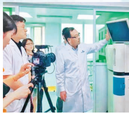
▲崔书中教授介绍精准腹腔热灌注化疗治疗技术设备

一项项耀眼的荣誉,是对崔书中教授仁心仁术、德高技湛的肯定:2010年荣获广东省五一劳动奖章、2010年当选广州亚运会火炬手,2011年获广州市优秀教师,2012年获广州市“121人才梯队工程”后备人才、