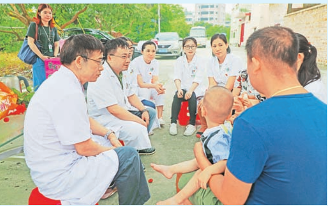
▲党员医护及志愿者探访花都试管早产双胞胎家庭