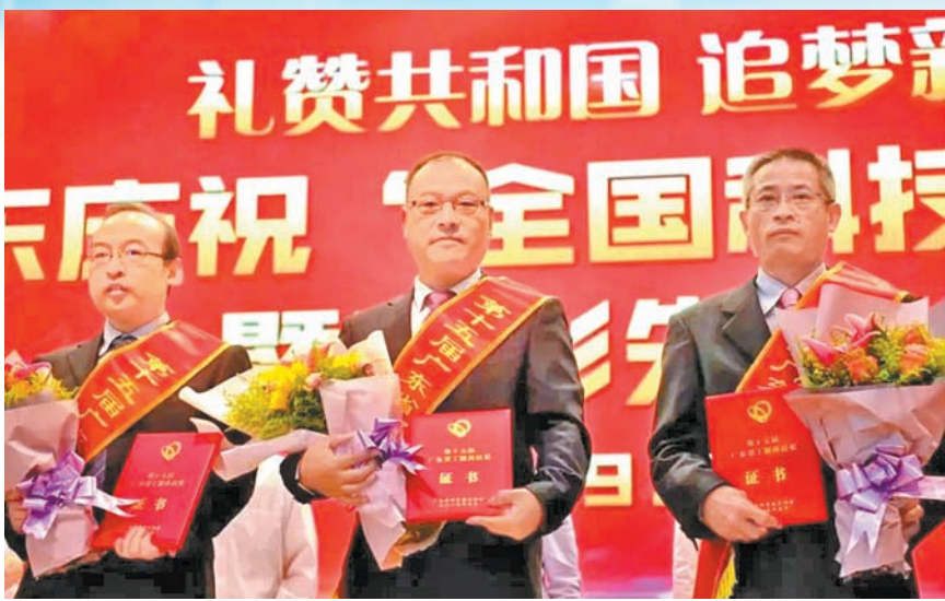
▲第十五届丁颖科技奖颁奖现场(左二为崔书中教授)

每年,中国有约百万癌症患者死于种植转移(*)。病人一旦发生癌细胞种植转移,就如在腹腔内“撒了几把沙子”,根本无法“捡”出来。如何将散落在腹腔和胸腔的癌细胞清除干净,是一大医学难题,传统的肿瘤治疗对此束手无策,以胃癌为例,一旦发生腹膜转移,病人的生存期平均只有6个月。从1987年当外科医生以来,崔书中教授在临床中见过太多发生种植转移的癌症患者。“没有办法就想办法,万物均有制衡,一定可以攻克这个难题。”攻坚克难的种子自此在他心中埋下,之后便三十年如一日潜心钻研种植转移。