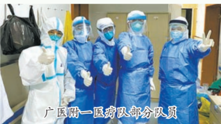
广医一院医疗队部分队员