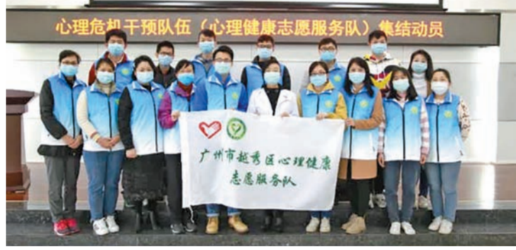
心理危机干预队伍（心理健康志愿服务队）集结动员

自1月29日起，越秀区疾控中心将心理疏导和转介服务等心理危机干预纳入疫情防控整体部署，率先开通全天候市民咨询热线服务（号码020-83815654），及时回应市民对于疫情的关注和心里诉求，做好心理疏导和情绪安抚工作。同时也依托心理援助热线“81899120”服务，提供24小时在线心理咨询、危机干预和转介等。（越秀疾控中心 江汀）