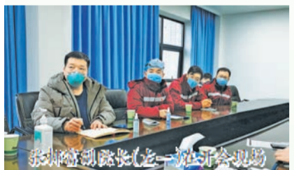
荆州曾书记(左一)主持会议