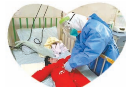
护士妈妈照顾宝宝

每天，医生、护士都会通过电话或微信把宝宝的治疗和生活情况告诉宝宝妈妈。看到医护人员照顾宝宝的细节，知道宝宝情况在好转，她的妈妈充满了感激：“每天能看到孩子的笑容和视频，这是对我的一剂良药。”