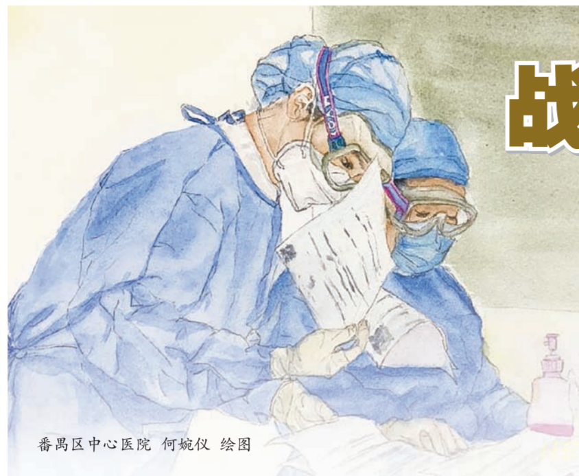
番禺中心医院 何婉仪 绘图