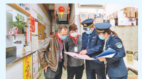
黄埔区卫生监督员一线工作照

临近学校开学，陆续有大学生提前返校，托幼机构可能会违规提前开学，学校疫情防控工作急需做在前面。越秀区卫生监督所组织卫生监督员全面检查辖区内5所大学的疫情防控工作，并对托幼机构关门情况进行监督检查。截至2月7日，越秀区卫生监督所共出动卫生监督员54人次，执法车辆15台次，检查学校及托幼机构16间次，责令改正2间次，发出卫生监督意见书6份，迎接市卫健委对辖区托幼机构关闭情况的督导检查1次。