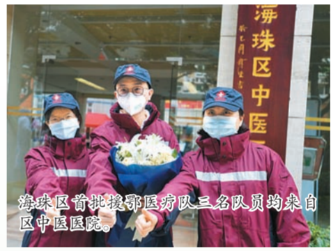
海珠区首批援鄂医疗队三名队员均来自区中医医院。