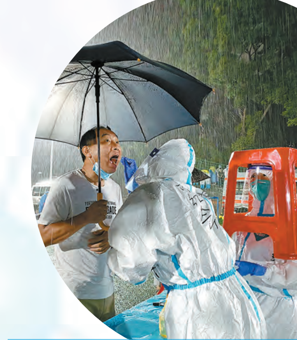
广州市红十字会医院医护人员冒雨采样。

时的扫码信息,所获得的孕妇的健康状况,可成为跨机构跨区域的重要信息流转,让妇幼健康服务提供更多的便利和保障。