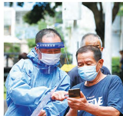
▲中心党员志愿队支援天河南街核酸检测工作

在本轮新冠疫情防控工作中,中心广大党员干部发扬了爱岗敬业、勇于担当的精神,以实际行动践行党员的初心和使命,为各级部门做好疫情防控工作提供有力支撑。