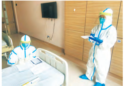
▲中心多名流调队员在新冠疫情防控一线,支援广州市疫情防控流调工作。