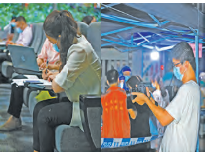
▲应急宣传队第一时间奔赴新闻发布会和核酸检测现场,开展采访、摄影、编写工作。

题。在《健康羊城》电视栏目、广播栏目、快手号、抖音政务号、N视频号、“广州市卫生健康宣传教育中心”及“健康羊城”微信公众号等自有媒体平台上持续推出防疫科普短视频、音频、微信推文、公益广告等;同时发放多款防疫宣传海报、折页、小册子、广州卫生健康单张等资料,为各区健康教育和定点医院开展防控宣传提供支持。自本轮疫情发生以来,共制作视频54个,微信推文56篇,海报20款,折页2款,单张1期。