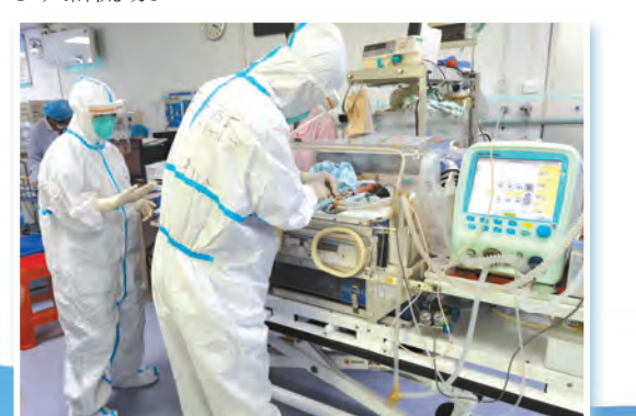
市妇儿中心接诊封控区转运的重症早产儿。

杨智聪建议,疫情期间要做好个人防护,坚持戴口罩、勤洗手、常通风,保持一米的社交距离;并减少出行,非必要不出市、减少聚集、减少人群流动。